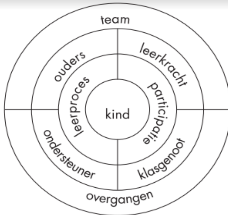
Schema 1: Kritische elementen voor een goede inclusiepraktijk